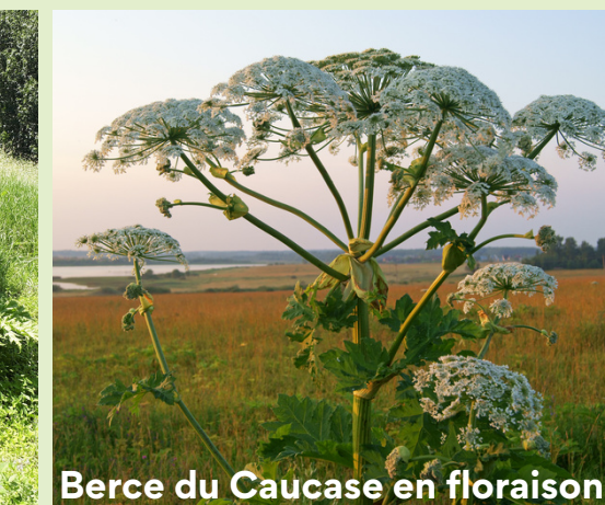
Berce du Caucase en floraison