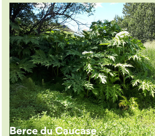
Berce du Caucase

Il faut faire preuve de prudence avec la berce du Caucase puisqu'elle est dangereuse pour les humains. C'est une plante phototoxique : sa sève provoque une réaction cutanée lorsqu'il y a eu un contact avec la peau suivi d'une exposition au soleil. Par réaction cutanée, on entend rougeurs, cloques, ampoules et brûlures au 1er ou 2e degré .